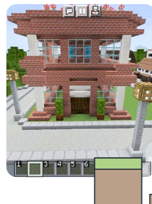
Het 'stadhuis van De Haren' gemaakt door het winnende team.

De wethouder prees de jonge ontwerpers om hun creativiteit: zwembad op het dak, gemeenschappelijke plekken om te chillen voor jong en oud, opvang van water en energie, dieren van de wijk én een achtbaan om mensen en boodschappen in te vervoeren. Zoveel ideeën en talenten, we gaan vast nog veel van deze stadsontwerpers-in-de-dop horen!